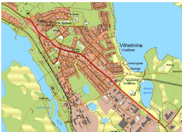
Bild 2. Volgsjövägen markerad med rött streck.

Även riksväg 360 är väl trafikerad med ett medeldygnsflyde på ca 750 fordon. Där är gaturummen öppna då det mestadels är skog kring vägen.