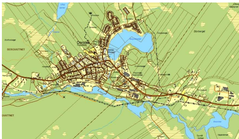
Bild 2. Dorotea samhälle

Den mest trafikerade vägen i Dorotea är E 45 som löper genom samhället Enligt Trafikverket har vägen ett teoretiskt medeldygnslöde på 2100 fordon. Genom samhället heter E 45an Storgatan. Ca 1,2 km av vägsträckan har fasader på båda sidor (bild 2). Gaturummet är öppet och antalet bostadshus är begränsat, det finns ett antal verksamhetslokaler längs vägen. Fasaderna ligger på 7-30 meter från vägen men är relativt glest utspridda, vilket gör att bedömningen är att gatan bedöms som ventilerad.