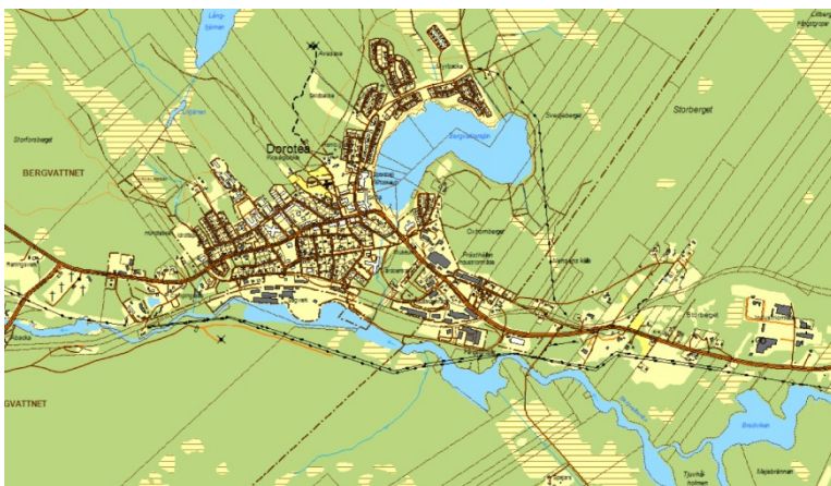
Bild 2. Dorotea samhälle

Den mest trafikerade vägen i Dorotea är E 45 som löper genom samhället. Enligt Trafikverket har vägen ett teoretiskt medeldygnslöde på 1940 fordon. Genom samhället heter E 45an Storgatan. Ca 1,2 km av vägsträckan har fasader på båda sidor (bild 2). Gaturummet är öppet och antalet bostadshus är begränsat, det finns ett antal verksamhetslokaler längs vägen. Fasaderna ligger på 7-30 meter från vägen men är relativt glest utspridda, vilket gör att bedömningen är att gatan bedöms som ventilerad.