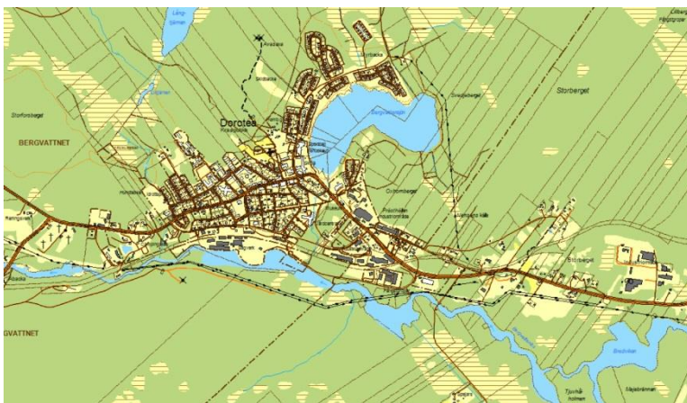
Bild 2. Dorotea samhälle

Den mest trafikerade vägen i Dorotea är E 45 som löper genom samhället Enligt Trafikverket har vägen ett teoretiskt medeldygnslöde på 1940 fordon. Genom samhället heter E 45an Storgatan. Ca 1,2 km av vägsträckan har fasader på båda sidor (bild 2). Gaturummet är öppet och antalet bostadshus är begränsat, det finns ett antal verksamhetslokaler längs vägen. Fasaderna ligger på 7-30 meter från vägen men är relativt glest utspridda, vilket gör att bedömningen är att gatan bedöms som ventilerad.