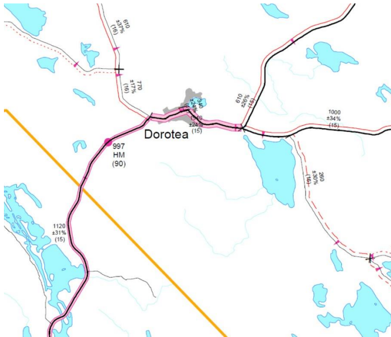
Bild 1. Trafikflödesinformation för Dorotea

I bild 1 redovisas de trafikflödesmätningar som redovisas på Trafikverkets hemsida.