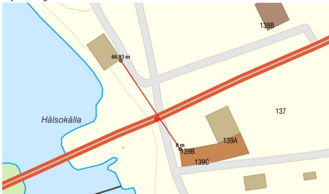
Figur 2 Översiktskarta - Ytterån