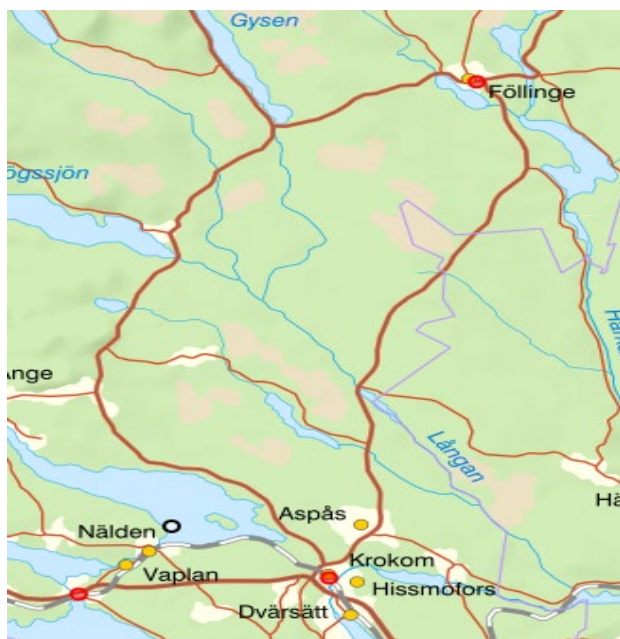
Figur 1 Översiktskart

Medelvärden för NO 2 samt PM 10 /PM 2,5 beräknades med hjälp av SMHI:s verktyg Voss ( http://voss.smhi.se/ ) Samtliga 3 platser beräknas vara under NUT riktvärden. Någon fördjupad kartläggning/mätning bedöms inte som nödvändig. Metodik och resultat av beräkningen finns i bilagan